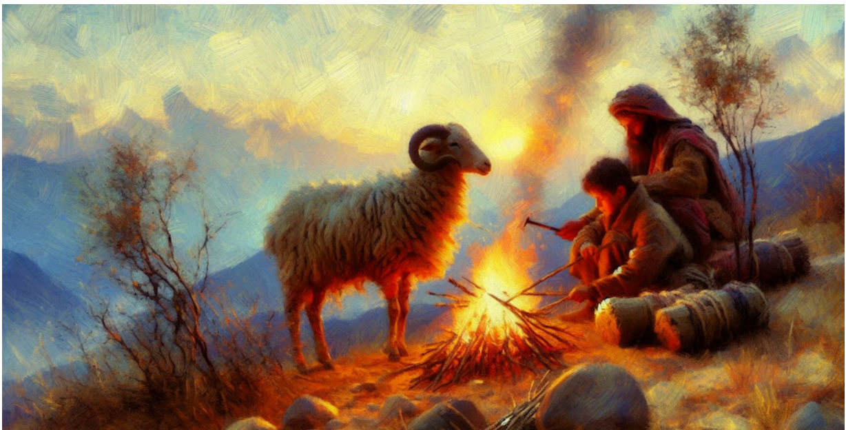
Abraham en Isaak