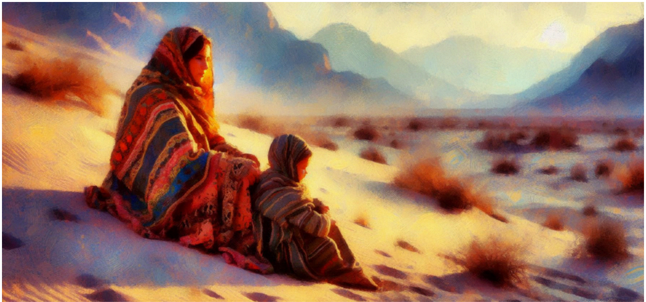
Hagar en Ismael in de woestijn