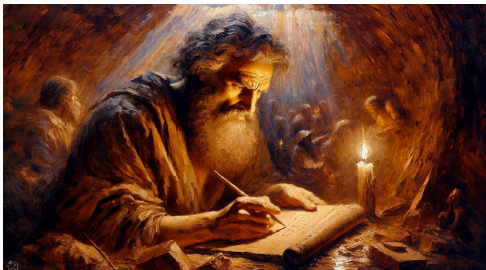
Noach schrijft zijn verhaal neer in de ark