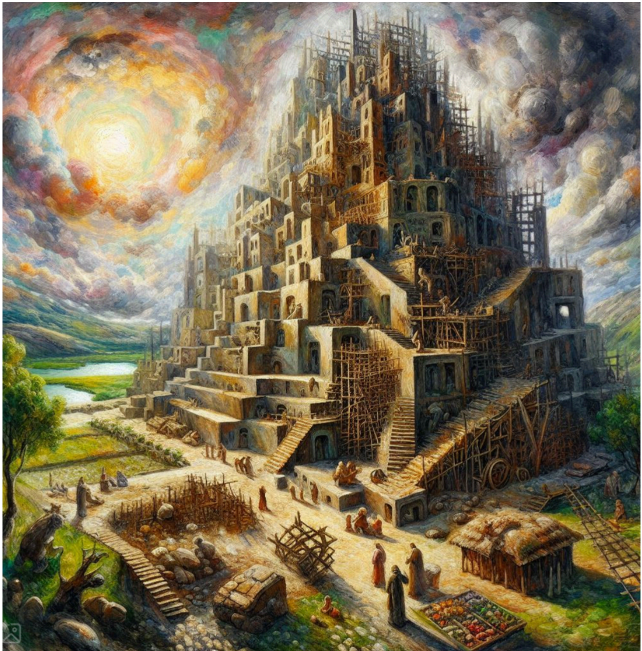
De bouw van de toren van Babel