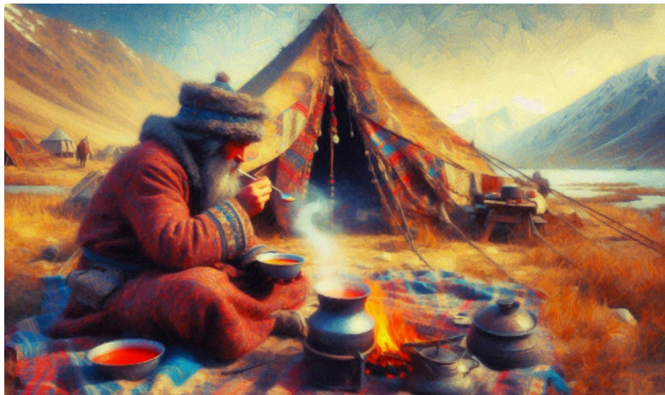
Esau eet zijn linzensoep