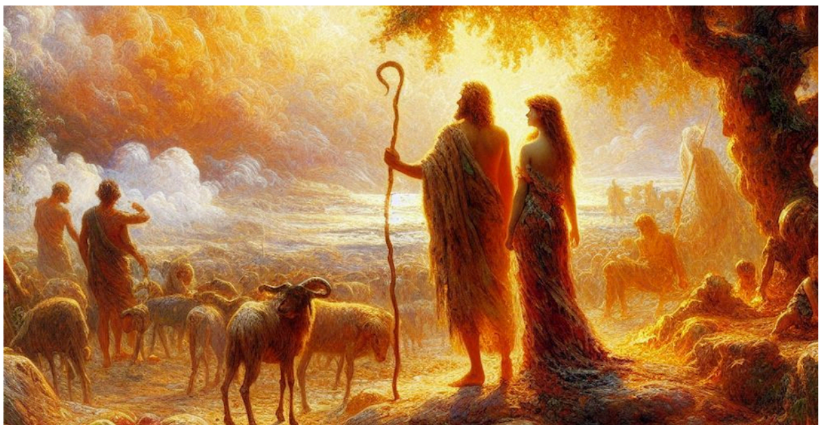
Isaac en Rebekka bij de kudde